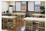
ダイニングルーム