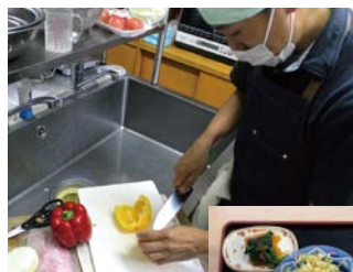
食事は調理員の手作り