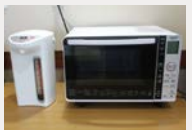
電子レンジ・湯沸かしポット